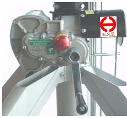
Hand-Betrieb bei Stromausfall durch eine Handkurbel