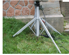
4 Teleskop Beine einzeln einstellbar für einen stabilen Stand bei ungleichen Böden oder Treppen