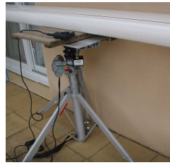
Spezial Bauart v. 1 Fuß bei Stand an einer Mauer