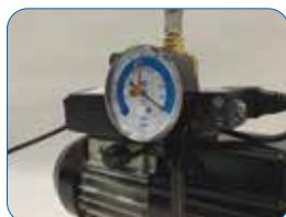
Collegamento con pompa per vuoto